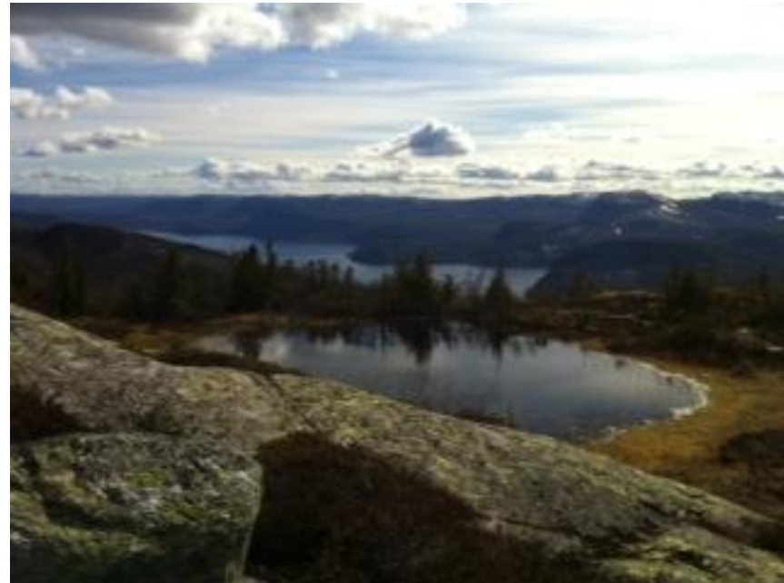
Utsikt frå Venlifjell

Det biologiske mangfaldet i kommunen har vore registrert, men framleis er det store deler av kommunen som endå ikkje er kartlagt. Naturmangfaldet må takast vare på og ein må gjennom all planlegging ta omsyn til det og unngå nedbygging av viktige lokalitetar og artar. Det er to naturreservat i kommunen, som må forvaltast på ein god måte