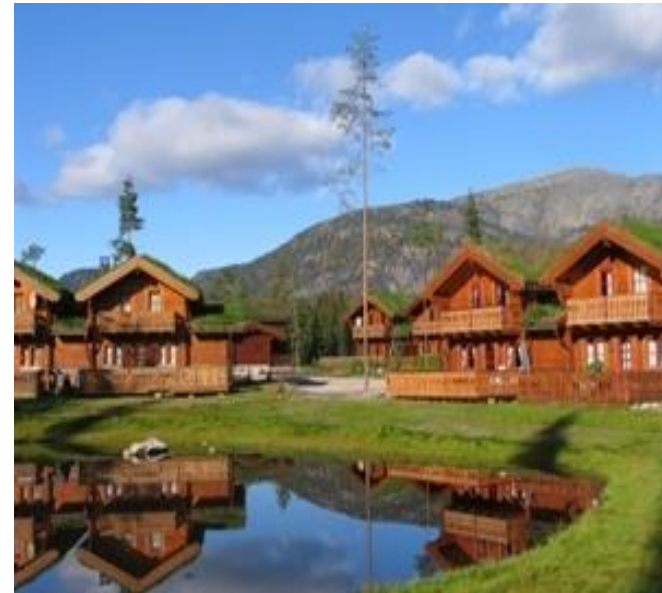
Bilete 10: Vrådal.

Utbygging av nye areal både til bustader og hytter gjev eit auka press på tilrettelegging av småbåthamner og det er liten/ingen kapasitet i dei eksisterande båthamnene i kommunen. Då båtplass og tilgang til vatn er viktig for mange av dei som ynskjer fritidsbustad i Kviteseid må det opnast for utviding av eksisterande småbåthamner og etablering av nye.