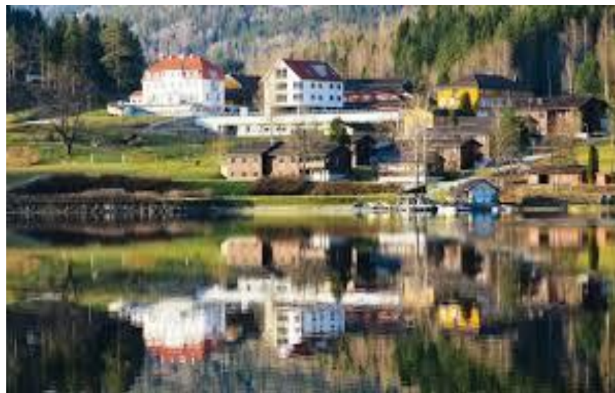
Bilete 2:Kvitsund

I tillegg til Kvitsund er Vest-Telemark vidaregåande skule viktig for Kviteseid.